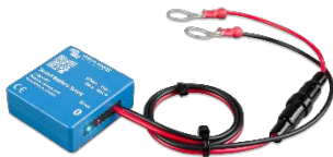
Detección de Bluetooth: Smart Battery Sense