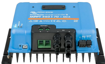
Controlador de carga SmartSolar MPPT 250/70-MC4 sin pantalla