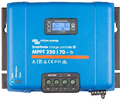
Controlador de carga SmartSolar MPPT 250/70-Tr Con pantalla conectable opcional.