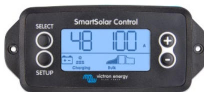
Pantalla enchufable SmartSolar