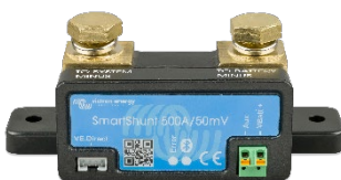
Detección Bluetooth: SmartShunt