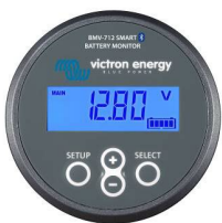
Detección de Bluetooth: BMV-712 Smart Battery Monitor